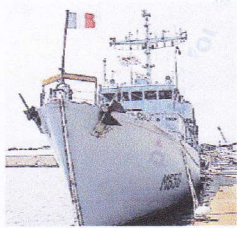
Le navire de la Marine sera visible mardi 14 et mercredi 15 juillet.

Le 14 juillet, Concarneois et touristes pourront visiter le Sagittaire, un bateau chasseur de mines de la Marine Nationale. En raison du Plan Vigipirate en vigueur, des règles strictes