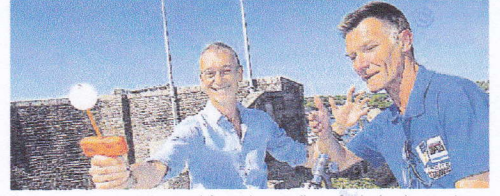
Le transmetteur spacio temporel, à gauche, sera l'arme fatale des deux noctambules.

À compter de ce lundi le service patrimoine de la ville inaugure une série de déambulations nocturnes dans la cité médiévale.